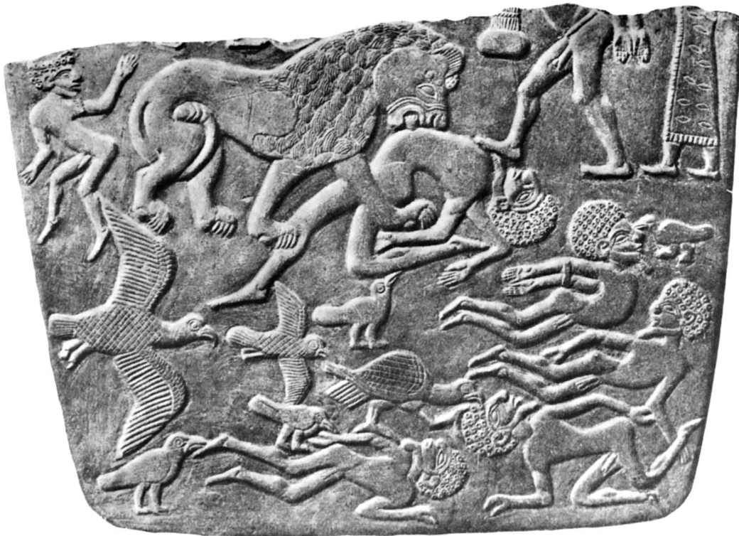
A. — Palette aux Vautours.