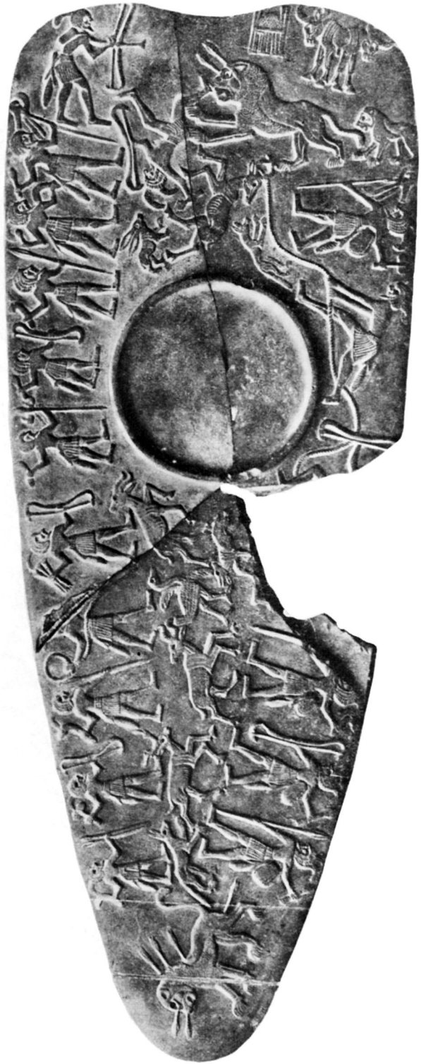
B. — Palette de la chasse reconstituée.