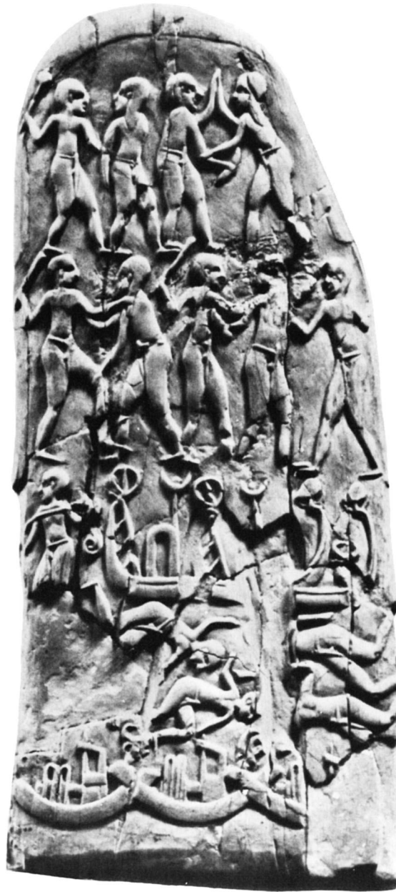
Manche du couteau du Gebel el-Arak.