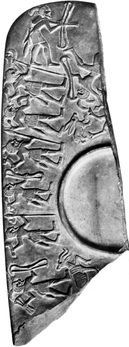
A. — Palette de la chasse. Fragment du Musée du Louvre.