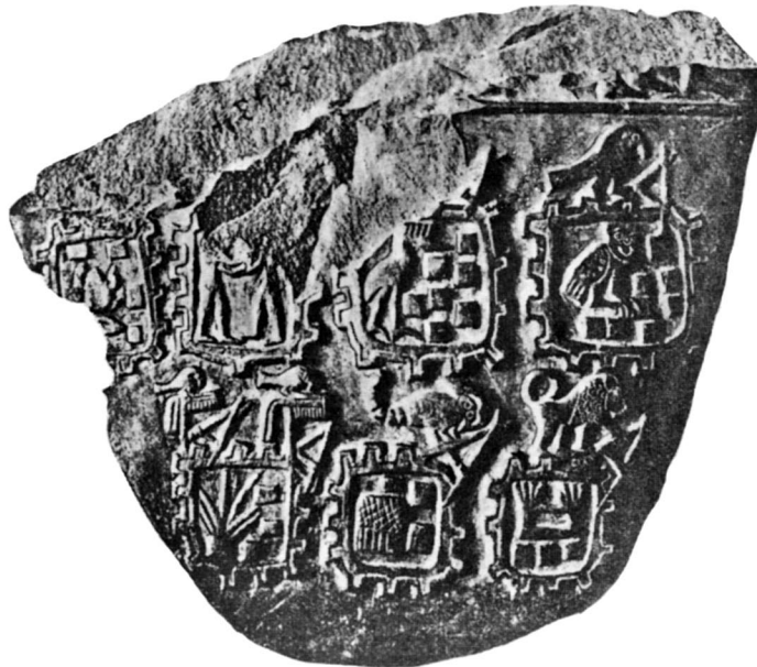
B. — Palette du « Tribut Libyen ».